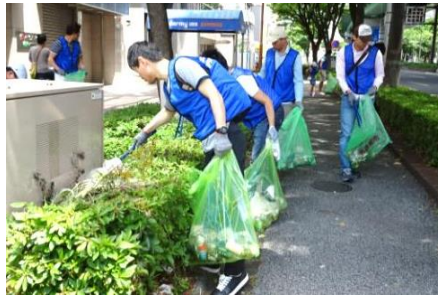
江川線の清掃活動