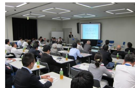
熱心に聴講する参加者