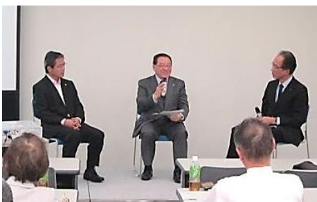
第2部 トークセッション