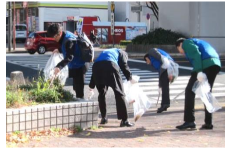
「年末クリーンキャンペーン」