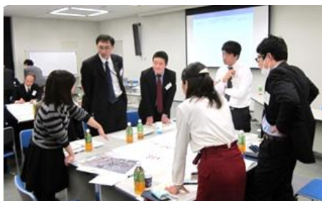
グループでの意見交換