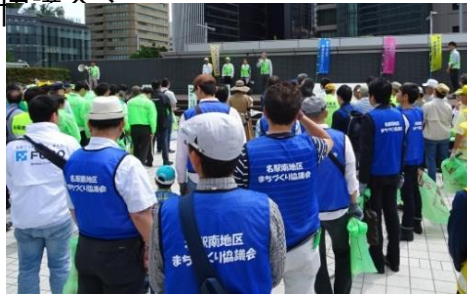
「全市一斉クリーンキャンペーン」出発式