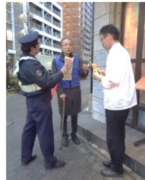
犯罪抑止・環境浄化推進地区の指定に伴うパトロール

※通年：沿道の一部にフラワーバスケット設置、3月：「名駅南地区まちづくり協議会便り」を発行