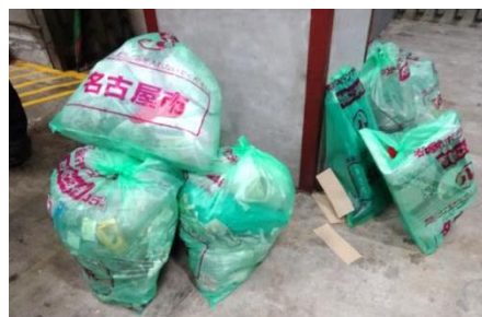
清掃活動で拾ったゴミ