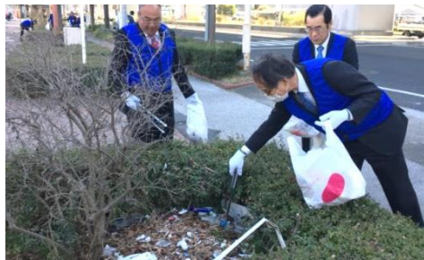
江川線の清掃活動