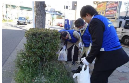
三蔵通の清掃活動