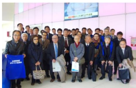
中京テレビ放送新社屋