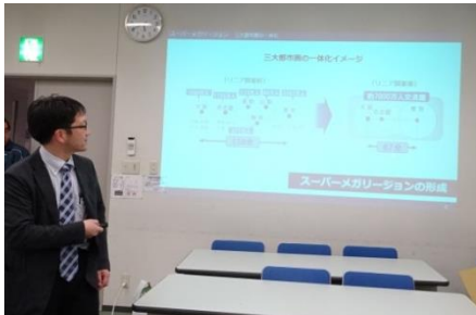
名古屋市担当者様から「リニア開業を見据えた名古屋駅周辺のまちづくり」の説明（第1回全体会）

協議会設立後は、9月13日の幹事会を皮切りに、今後の協議会活動やまちづくりビジョンについての検討を開始し、平成28年度は幹事会を計5回、全体会を計2回開催しました。