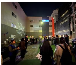
公園での上映会 (五千人祭)