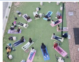
コンペのヨガ企画

「名駅南をもっとクリエイティブなまちに！」をテーマに今年度も多数の企画を実施しました。1つ目は、『クリチャレコンペ』。クリエイターを公募し、展示やパフォーマンスを実施して頂く企画。11月の公開審査により4名を採択し、協賛企業の協力も得て、これまでの名駅南にはなかった新鮮な企画が12月～2月に多数展開されました。2つ目は11月24日に開催した『五千人祭』。名駅南の住民は約5千人、そんな5千人が顔を合わせ、クリエイティブを発掘するイベント。祢宜公園のほか、道路空間活用実験も兼ねて、公園前や四季劇場前などの歩車道も活用し、パネル展示やメッセージボードなど道行く人が楽しめる企画を実施。夜には公園で建物壁面を活用した上映会も開催。まち全体を盛り上げました。そのほか、2月には、コーヒークラスを活用したワークショップや今後を考える公開サロンも実施しました。